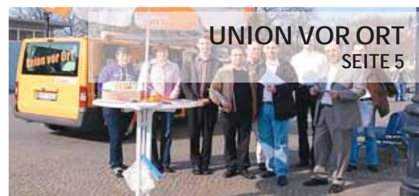
UNION VOR ORT SEITE 5