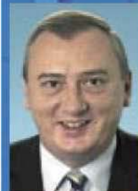
Ingo Schmitt Landesgruppenvorsitzender

Die Bundestagsabgeordneten der Berliner Landesgruppe in der CDU/CSU-Bundestagsfraktion