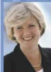
Prof. Monika Grütters

Tel: 030. 227-70222 Fax: 030. 227-76223 www.monika-gruetters.de