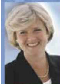
Prof. Monika Grütters

Tel: 030. 227-70222 Fax: 030. 227-76223 www.monika-gruetters.de