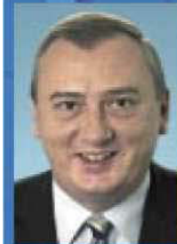
Ingo Schmitt Landesgruppenvorsitzender

Die Bundestagsabgeordneten der Berliner Landesgruppe in der CDU/CSU-Bundestagsfraktion