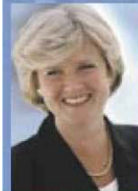
Prof. Monika Grütters

Tel: 030. 227-70222 Fax: 030. 227-76223 www.monika-gruetters.de