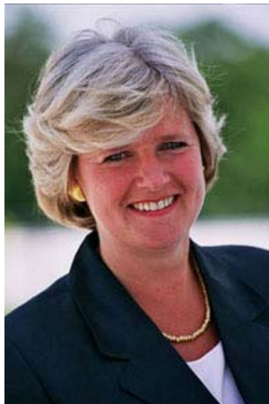
Monika Grütters ist seit September 2005 Mitglied des Deutschen Bundestages und auch Mitglied der Gruppe der Frauen der CDU/CSU Fraktion im Deutschen Bundestag.